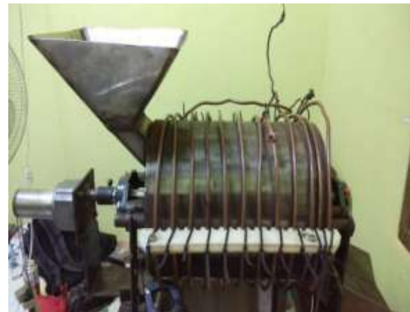
Gambar 3. Alat mesin sangrai kopi pemanas induksi

Penulis telah melakukan perancangan alat mesin sangrai kopi pemanas induksi, kemudian menentukan bahan dan dimensinya, serta mulai menyiapkan alat dan bahan untuk pembuatan alat tersebut. Sejauh ini, yang sudah dibuat adalah satu unit mesin peyangrai kopi pemanas induksi dan bisa dioperasikan. Alat mesin sangrai kopi pemanas induksi yang dibuat dapat dilihat pada gambar 3.