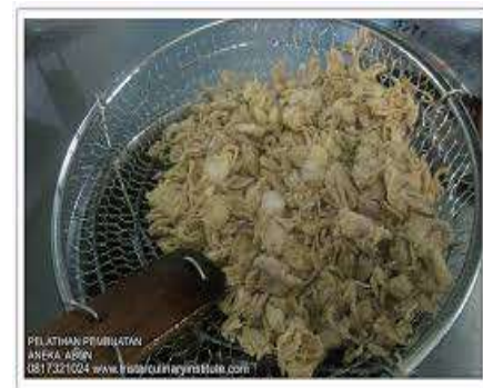
. Bawang Goreng