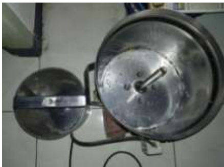
Gambar Mesin Peniris Bawang Goreng

Langkah pertama yang kita lakukan adalah mempersiapkan komponen mesin yang akan kita gunakan dalam proses pengujian, yaitu mesin peniris dan 3 buah tabung putar dengan berbeda ukuran.