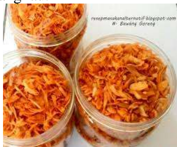
Gambar Bawang Goreng

Bawang goreng merupakan makanan yang terbuat dari bawang merah yang digoreng dengan minyak. Bawang goreng banyak didapat di toko atau warung yang sudah dikemas dan juga ada yang diberi label. Rasanya yang nikmat serta harganya yang terjangkau.