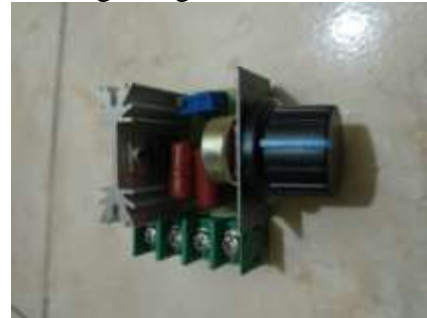
Gambar Pengatur Kecepatan

saat proses pengujian, yaitu stopwatch, tachometer, inverter/speed controller motor AC, timbangan digital.